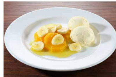
Flambierte Früchte in Orangen-Soße