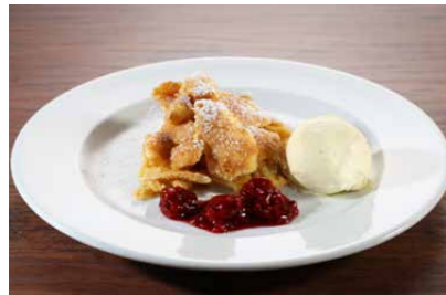
Kaiserschmarren mit Vanilleeis und Beeren