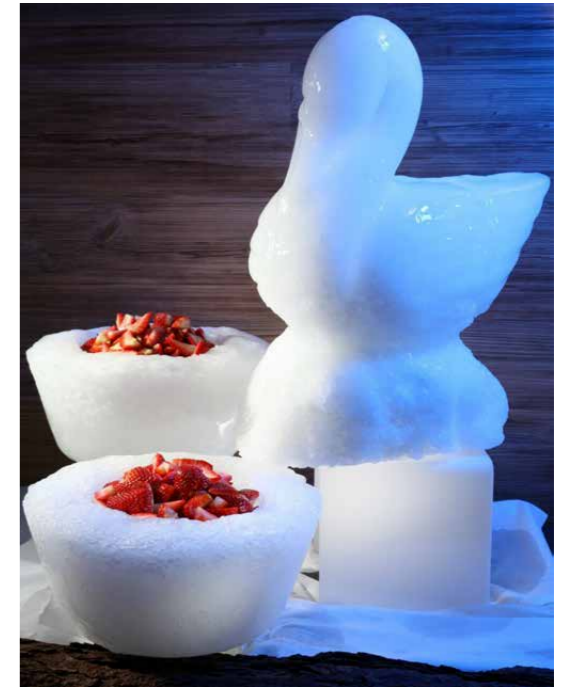
Eisskulptur mit frischen Früchten