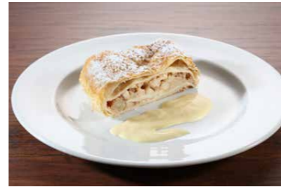
Apfelstrudel mit Vanillesoße