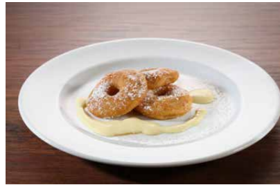
Apfelküchle mit Vanillesoße